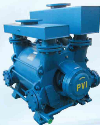
2B4200 - 2B5000