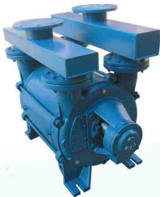
T1102 - T1602